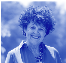
MADAME LA SÉNATRICE JACQUELINE EUSTACHE-BRINIO

Sénatrice du Val-d'Oise depuis le 24 septembre 2017