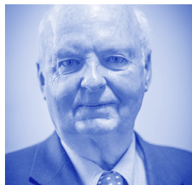
PROFESSEUR DIDIER SICARD

Sénatrice du Val-d'Oise depuis le 24 septembre 2017